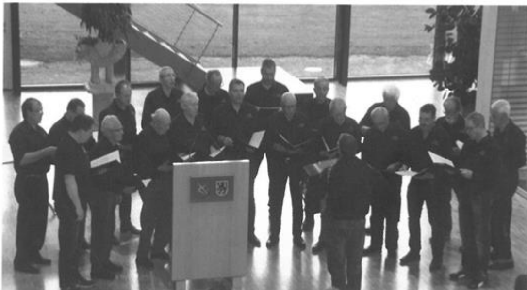
Umrahmung der Blutspender Ehrung in der Stadthalle am 01. Juni 2016.